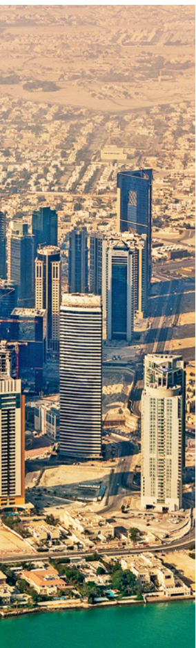
↑ Катар позиционирует себя как ближневосточный хаб для инвесторов

составил 17%. В 2019 году терминал DohaPort приобрел сразу 57 круизных лайнеров, которые в тот же год перевезли 127,6 тыс. пассажиров. Глобальная пандемия, конечно, резко сократила поток туристов. Однако, по оценкам HSBC Global Research, после снятия международных ограничений на путешествия этот сектор экономики будет восстанавливаться за счет усиления стимулирования властями туристической отрасли, предоставления льгот Qatar Airways, организации международных спортивных и других мероприятий, строительства новых фешенебельных отелей.